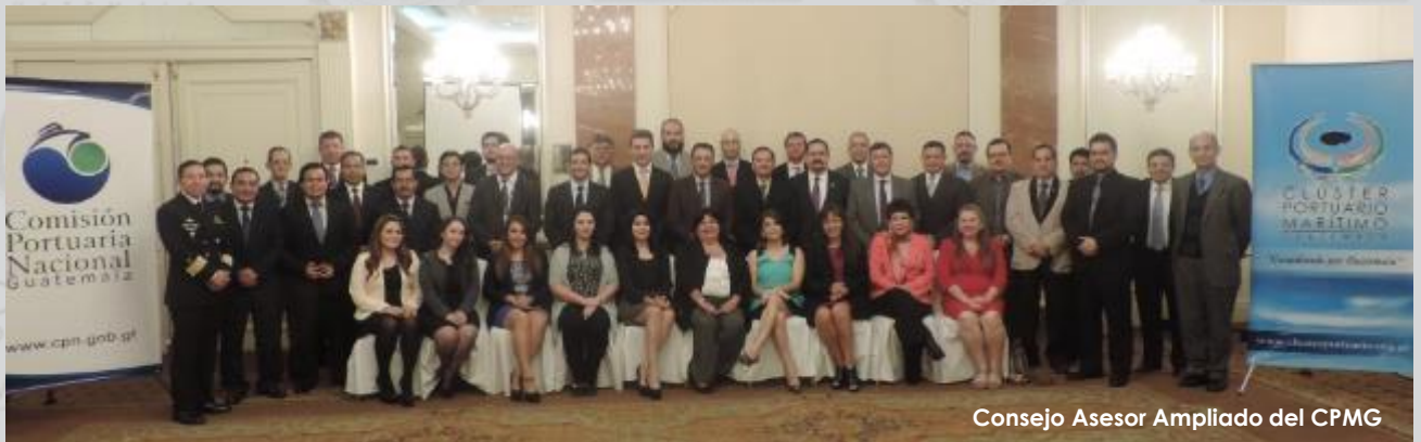
Consejo Asesor Ampliado del CPMG

El Clúster Portuario Marítimo culminó sus actividades del año 2015 con la Presentación de un informe de actividades por parte de los coordinadores de comités de trabajo al pleno del Consejo Asesor Ampliado e invitados especiales.