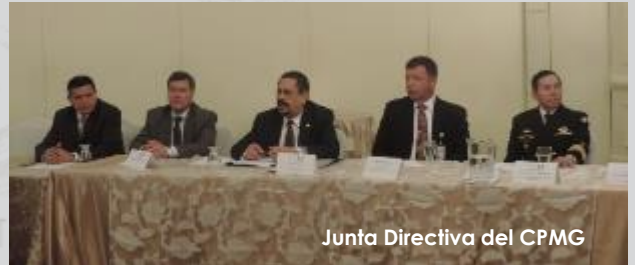
Junta Directiva del CPMG

Estos son algunos números que resumen los logros de 2015 para el Clúster: